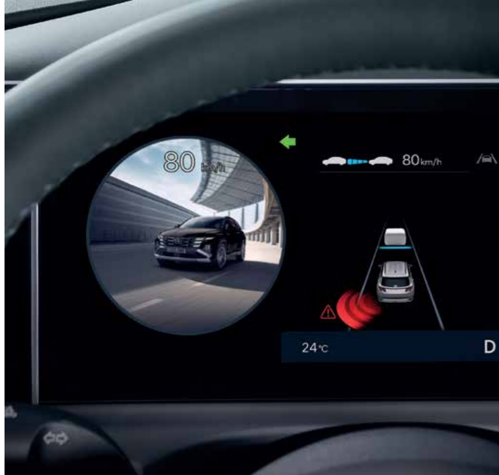
Blind-Spot View Monitor (BVM)

The new TUCSON is packed with reliable features to protect you from the unexpected and ensure you leave no one behind.