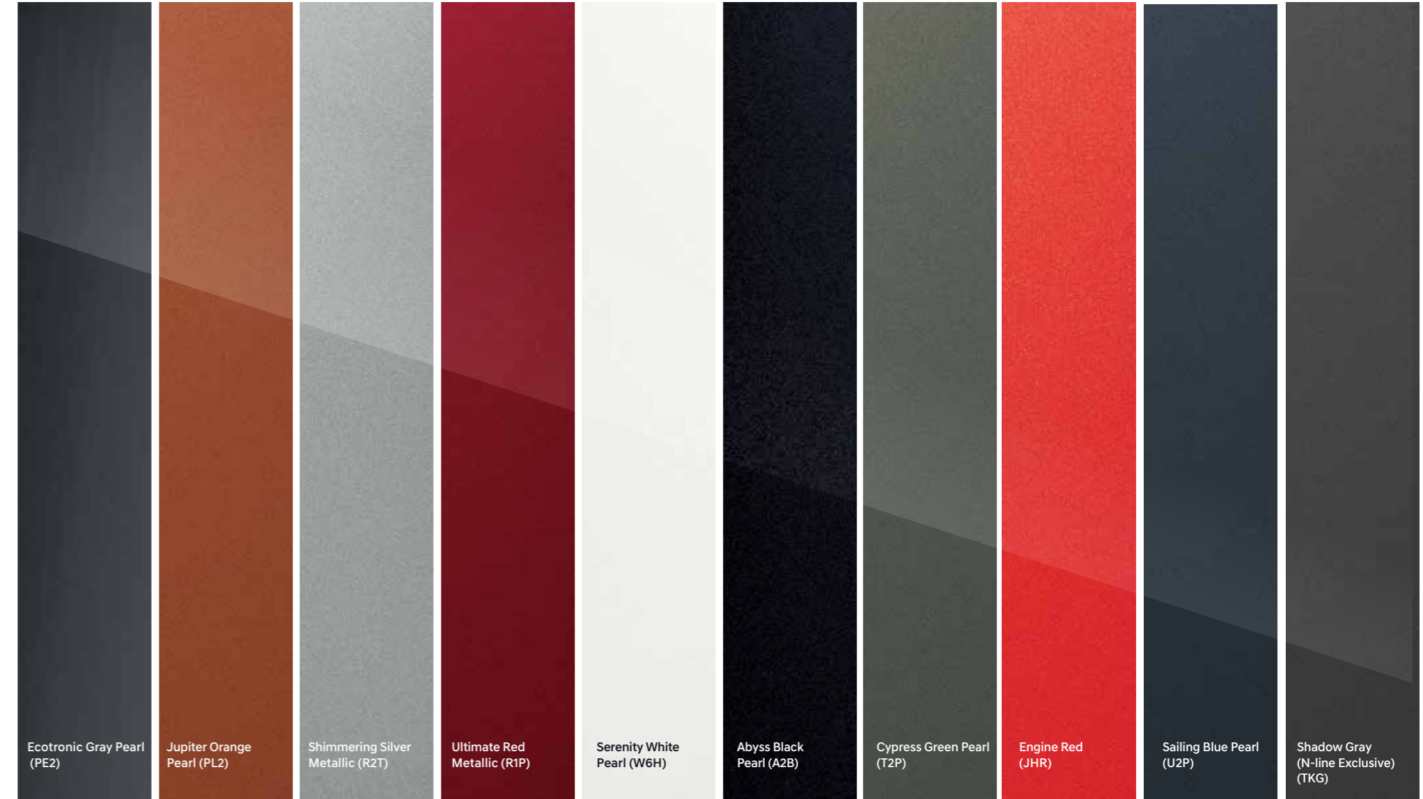
Ecotronic Gray Pearl (PE2)