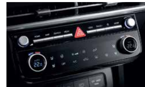
Full Auto Air Conditioning System