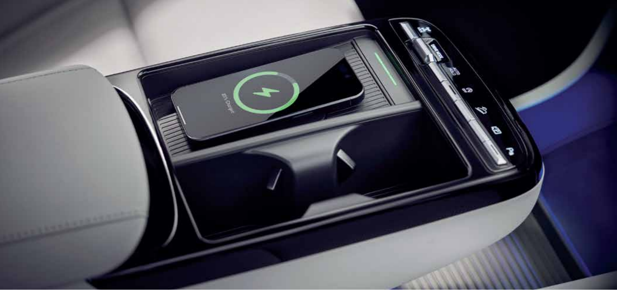
Wireless Power Charger (WPC)

A reinvented layout with a host of intuitive technologies that enable an effortless and convenient on-the-road experience.