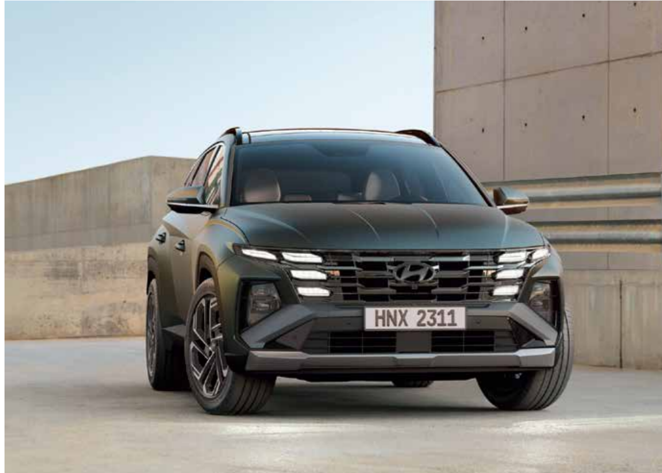
Parametric Jewel Hidden Signature Lamps

Reject the ordinary with eye-catching jewel-like elements of the front lamps as well as around the sides - boldly upgraded to allow you to stand out from the crowd.