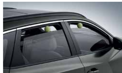
Safety Power Window