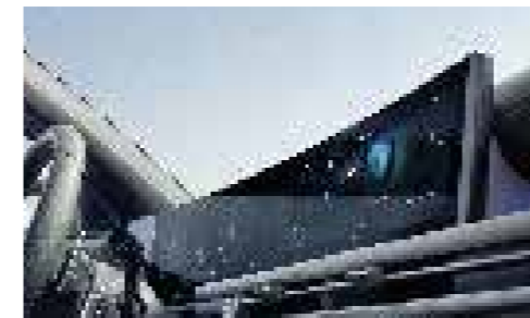
12.3" TFT-LCD Cluster Screen