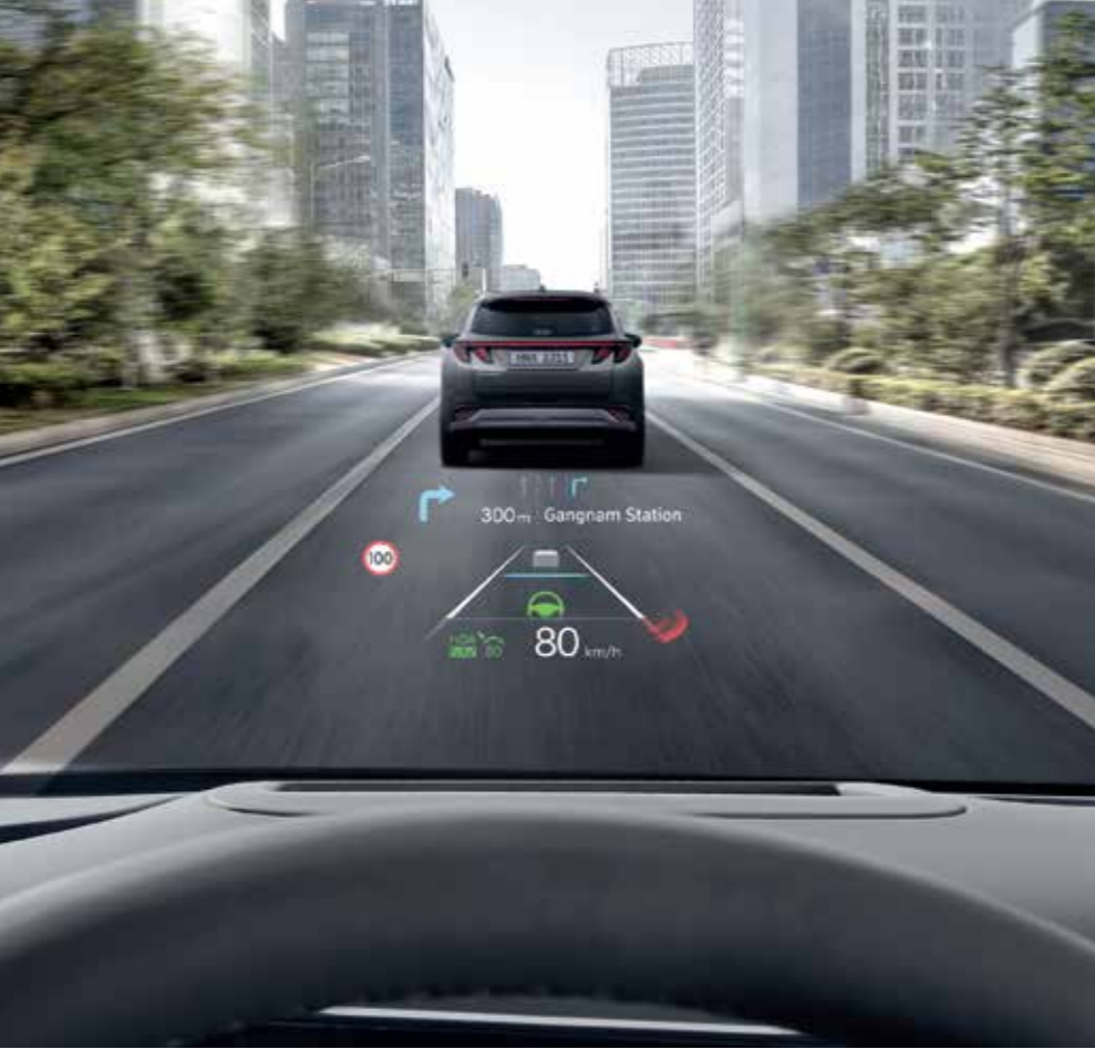
12-inch Head-up Display (HUD)