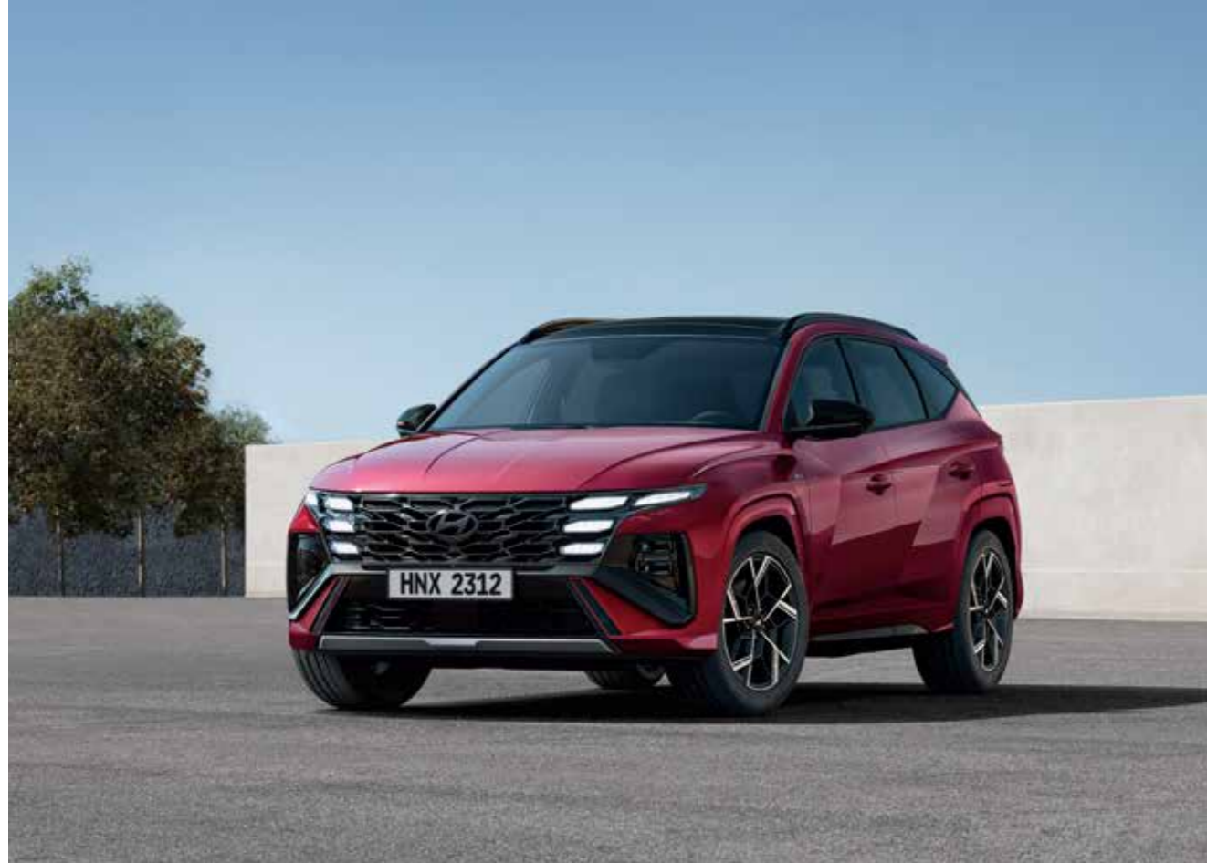
N Line Exclusive Radiator Grille

Packaged with an exclusive design, the new TUCSON N Line awaits those who desire that extra touch of sportiness.