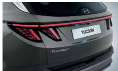
LED Rear Combination Lamps