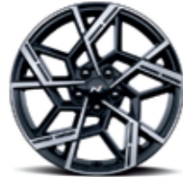
19" alloy wheels (N-Line)