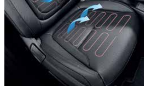
Front Ventilated Seats