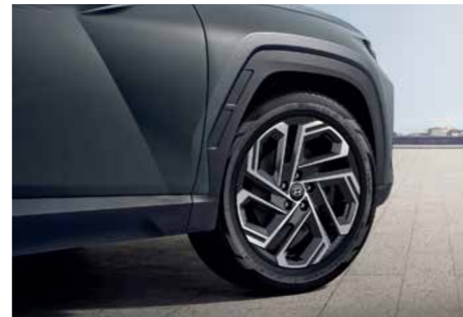
19-inch Alloy Wheels