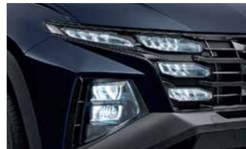
Full LED Headlamps (MFR Type)