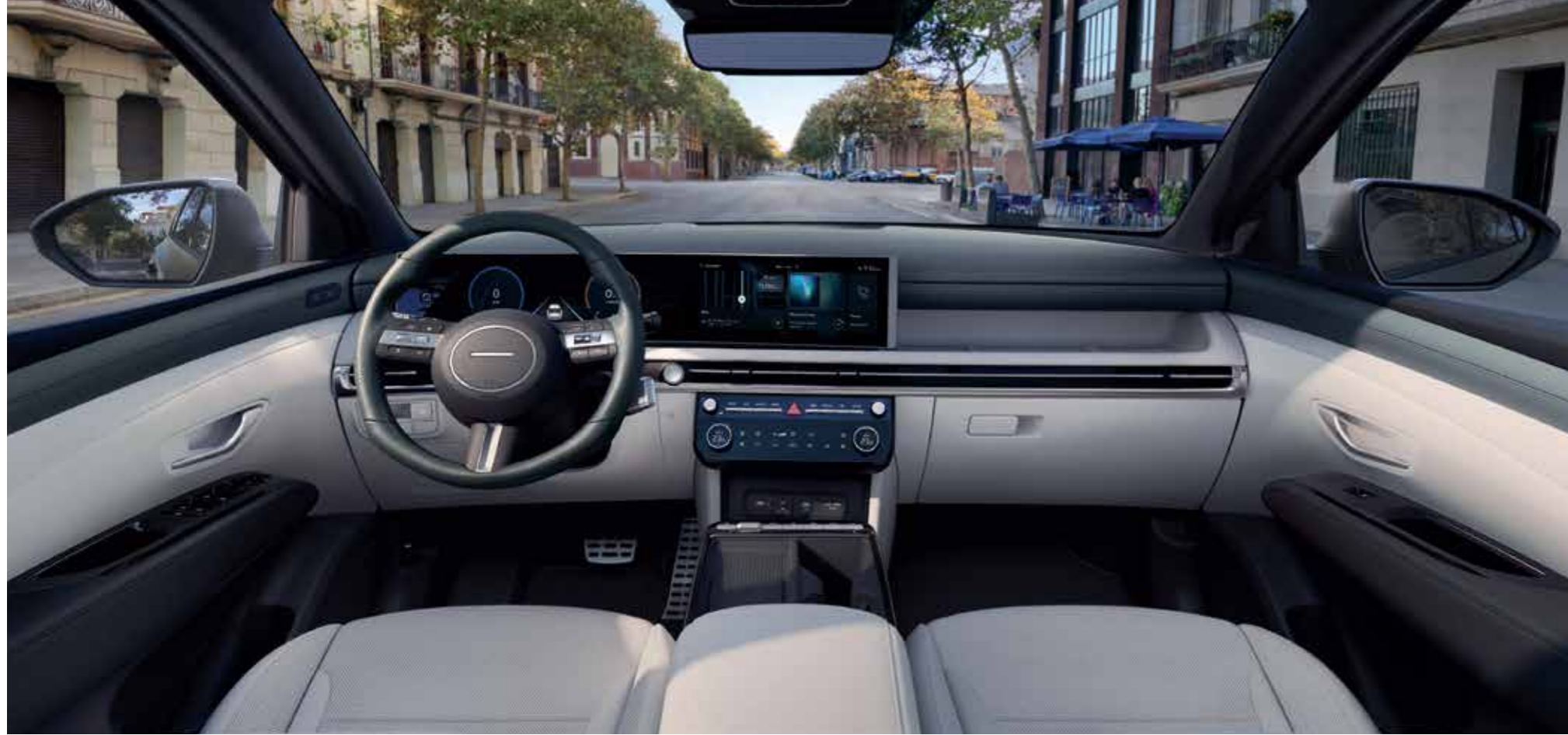
Wrap-Around Architecture Design

The cabin's wide horizontal design wraps around the interior, enveloping the passengers with a seamless architecture that integrates technology and style.