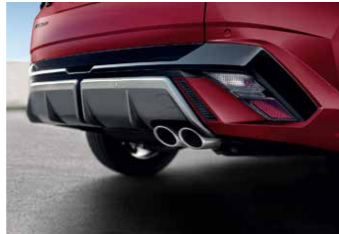
N Line-Exclusive Single Twin Tip Muffler