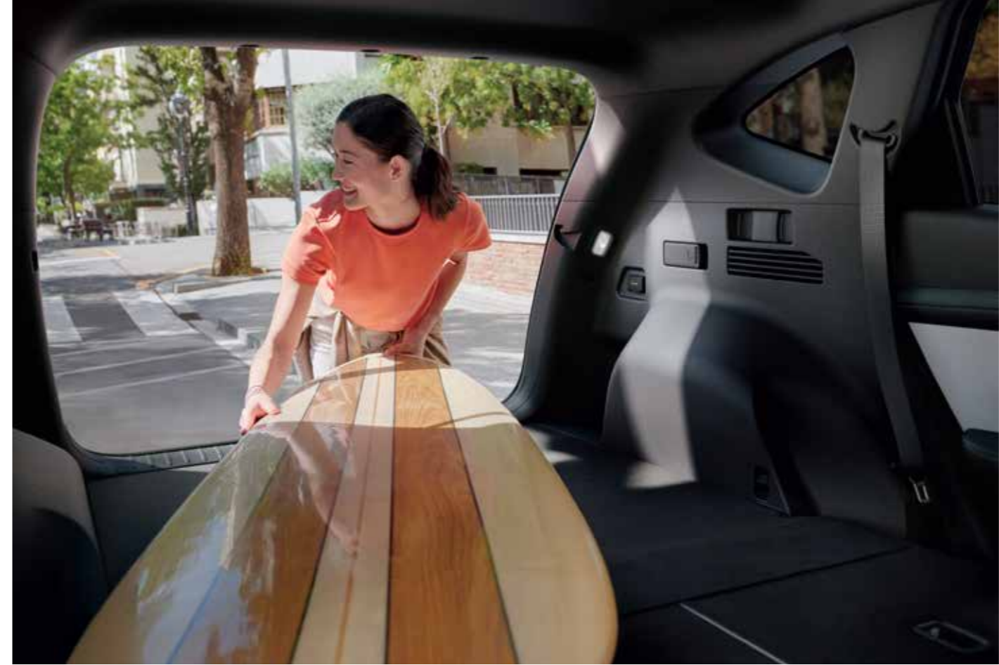
Folding Seats / Remote Folding System