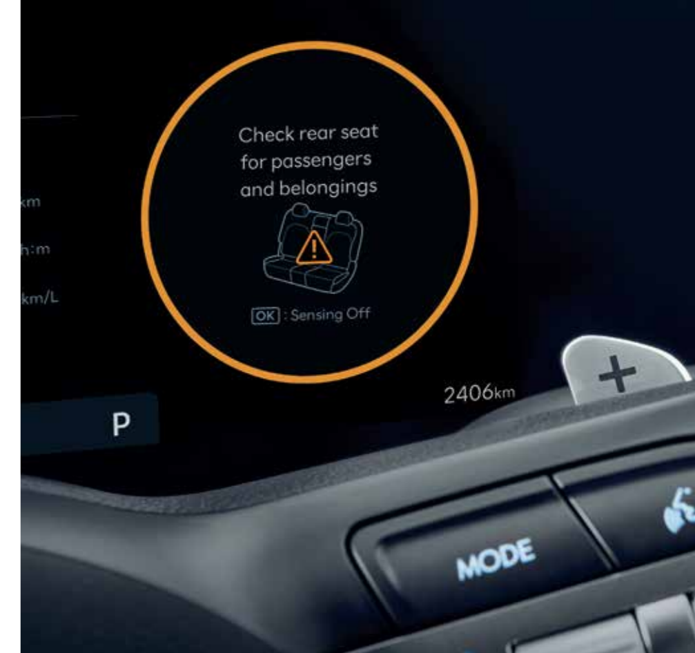
Rear Occupant Alert (ROA)