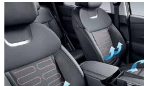
Front Ventilated Seats