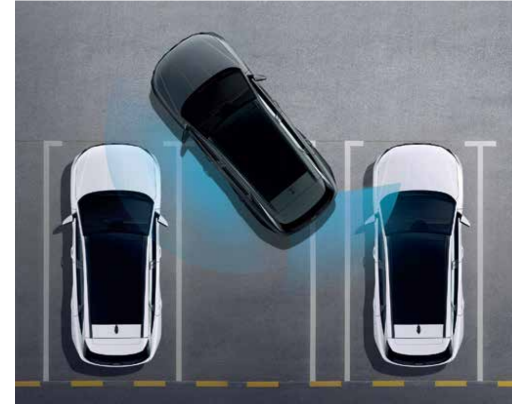
Forward/Side/Reverse Parking Distance Warning (PDW) Forward/Side/Reverse Parking Distance Warning (PDW) warns against collisions with objects around the vehicle at low speeds.