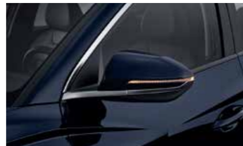
Turn Signal Indicator LED Outside Mirror