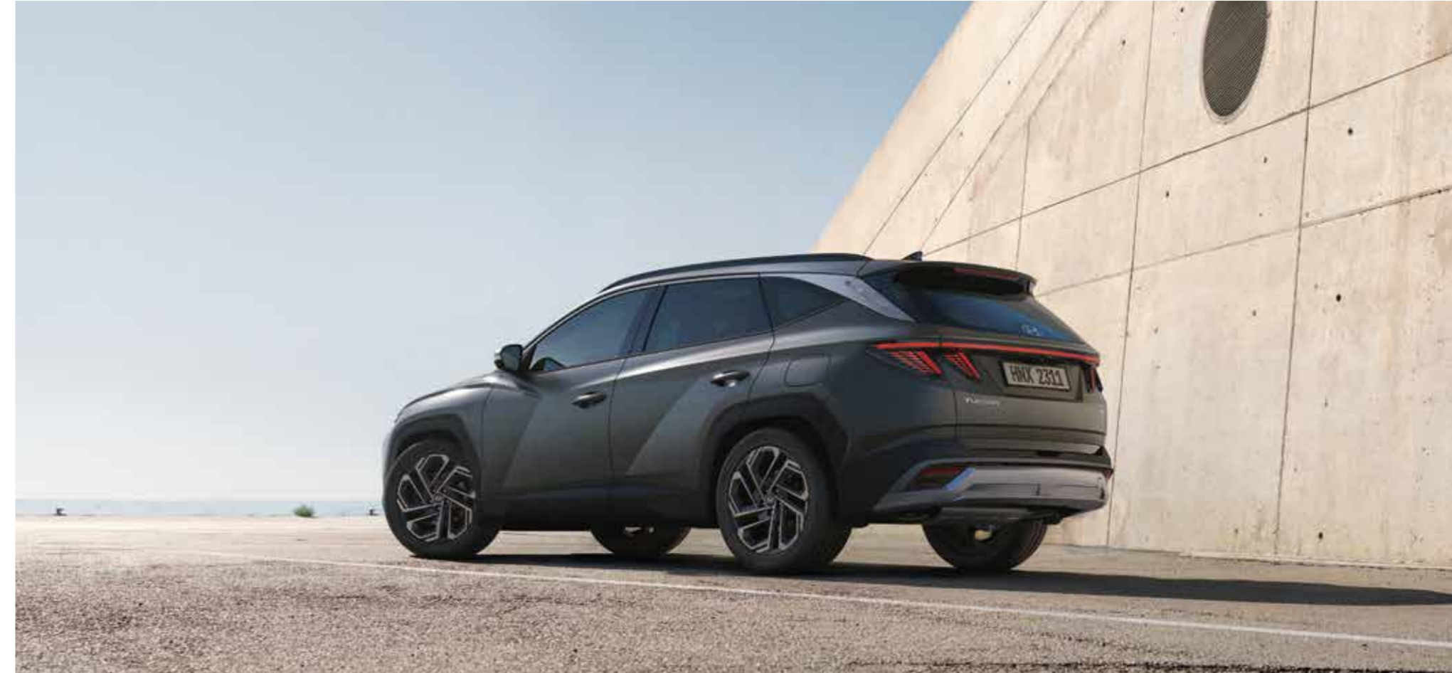
Parametric Jewel Surfaces