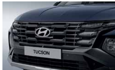
Dark Metal Paint Radiator Grille (Clear Type DRL)