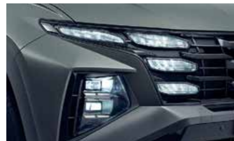
Full LED Headlamps (Wide Projection with IFS Function)