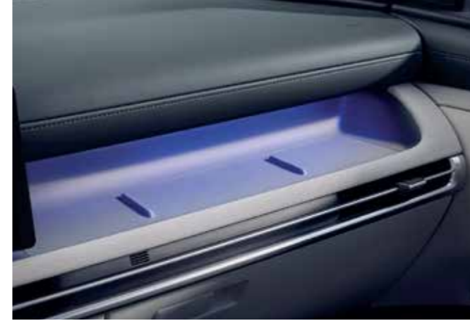
Ambient Mood Lamp / Multi-tray