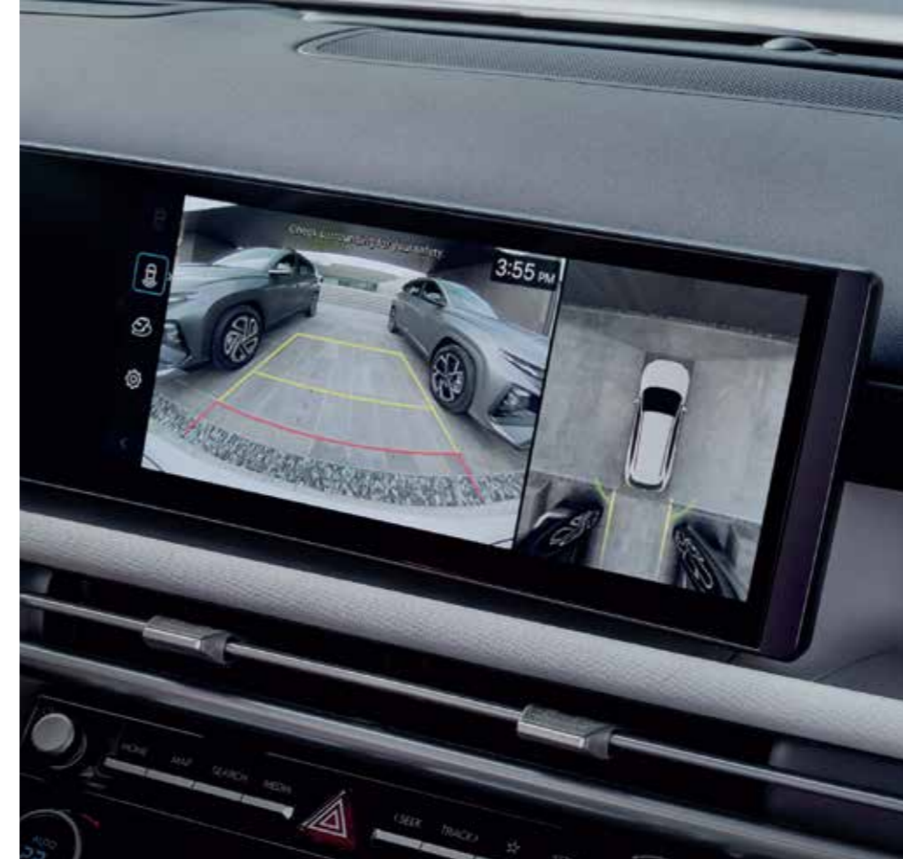
Surround View Monitor (SVM)