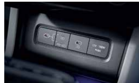
USB-C Data/Charging Ports