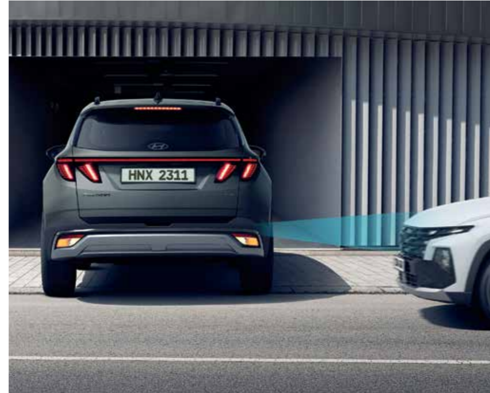
Parking Collision Avoidance Assist (PCA) Reverse Parking Collision Avoidance Assist (PCA) provides a warning if there is a risk of collision with a rear object while reversing. After the warning, if the risk of collision increases, it automatically assists with emergency braking.