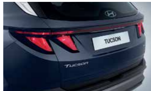
Rear Combination Lamps (Bulb Type)