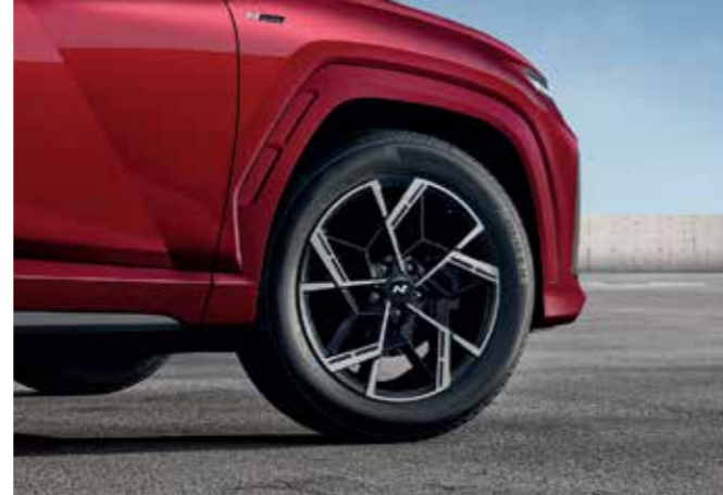
N Line-Exclusive 19-inch Alloy Wheels / Body-color Cladding