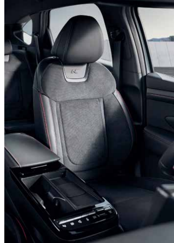
N Line-Exclusive Suede Seats