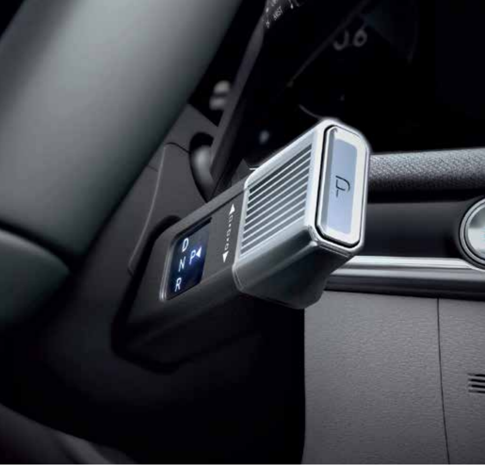
Column-type Shift by Wire (SBW)