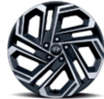
19" alloy wheels (Optional)