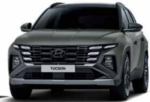
1.6 Turbo GDI