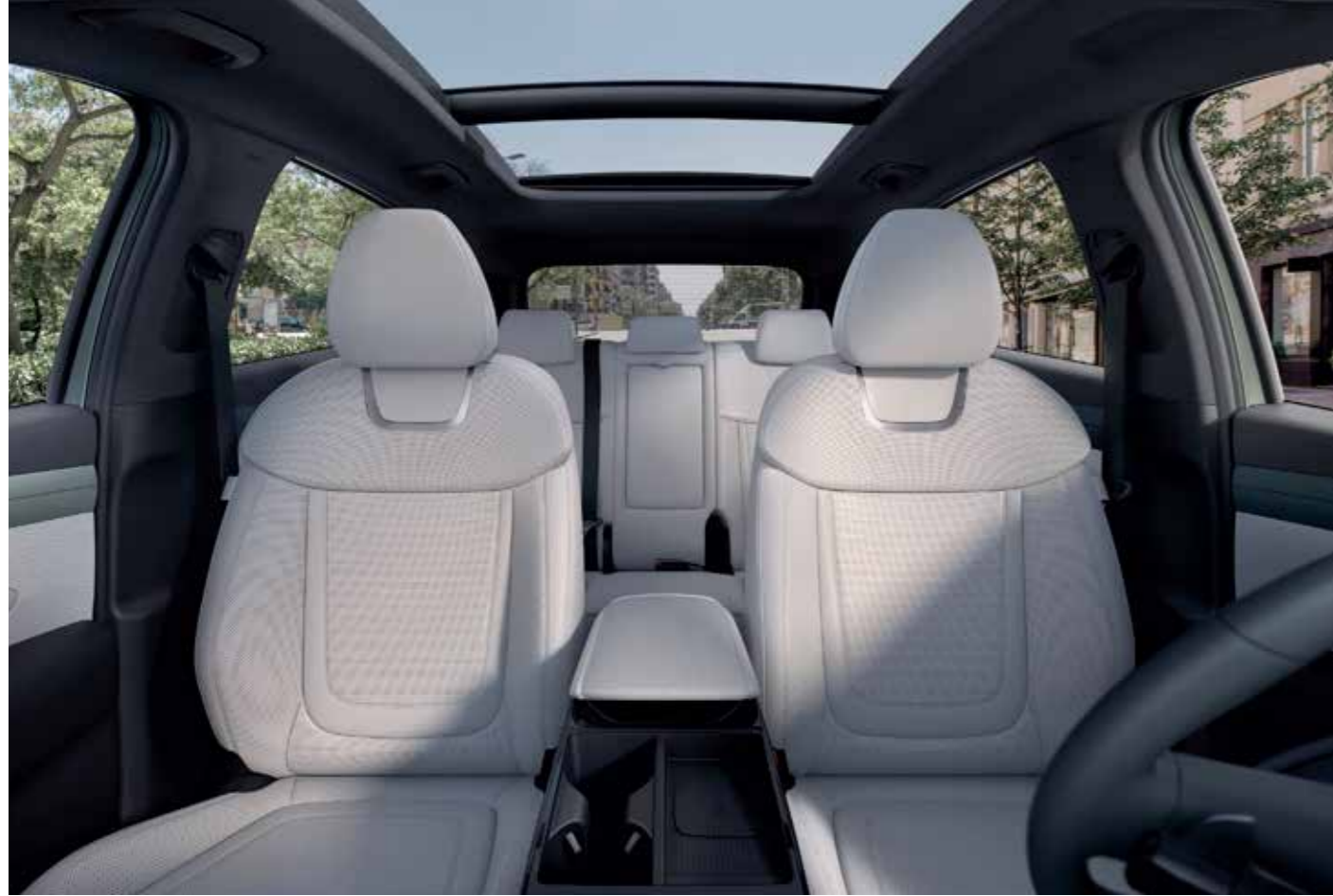
1st & 2nd Row Seat

Make room for more. Its best-in-class cargo space and roomy interior support various lifestyles and activities, offering more versatility than ever.