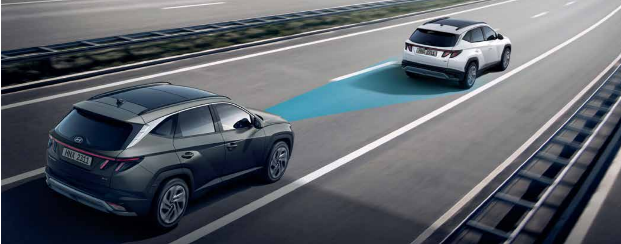
Smart Cruise Control (SCC) Smart Cruise Control (SCC) helps maintain distance from the front vehicle and drive at a speed set by the driver. Automatically stops when the front vehicle stops and automatically starts when the front vehicle departs within a short time.