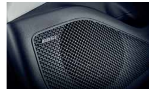
BOSE Premium Sound System