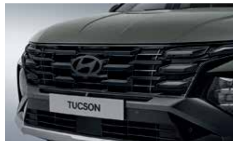
Dark Tinted Chrome Radiator Grille (Hidden Lighting DRL)