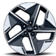
18" alloy wheels (Standard)