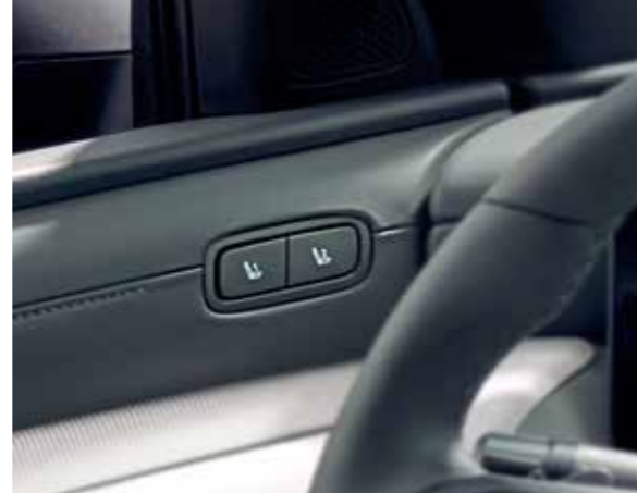
Integrated Memory Seat