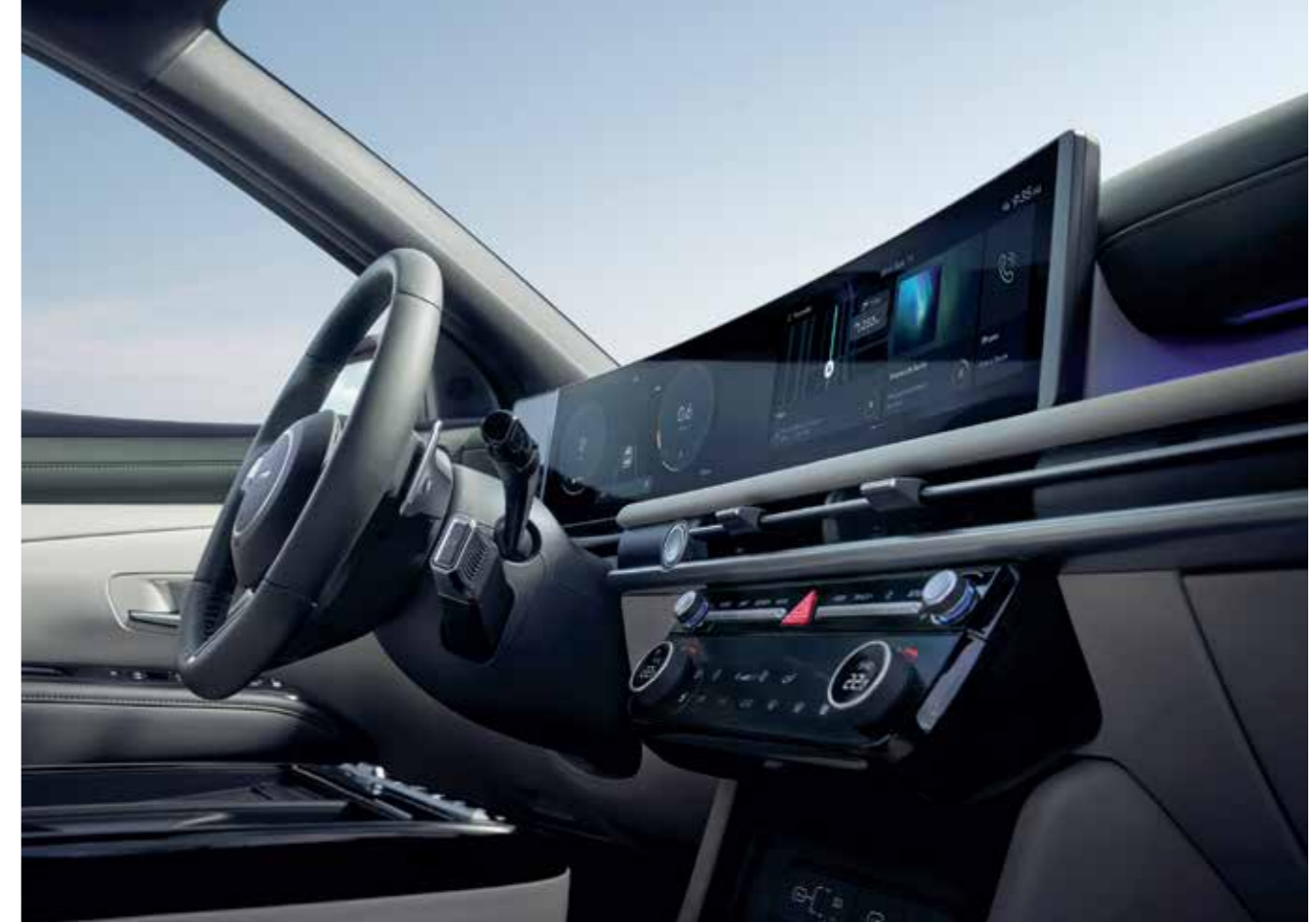
Panoramic Curved Display 12.3-inch (Cluster) + 12.3-inch