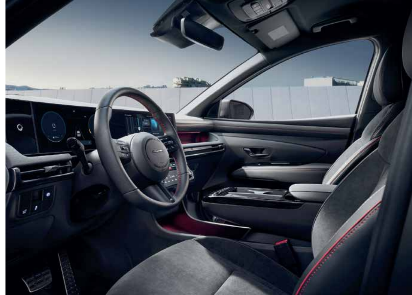
N Line-Exclusive Interior (N Line Emblem Steering Wheel / Red Stitching)