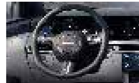
Tilt & Telescopic Steering Wheel