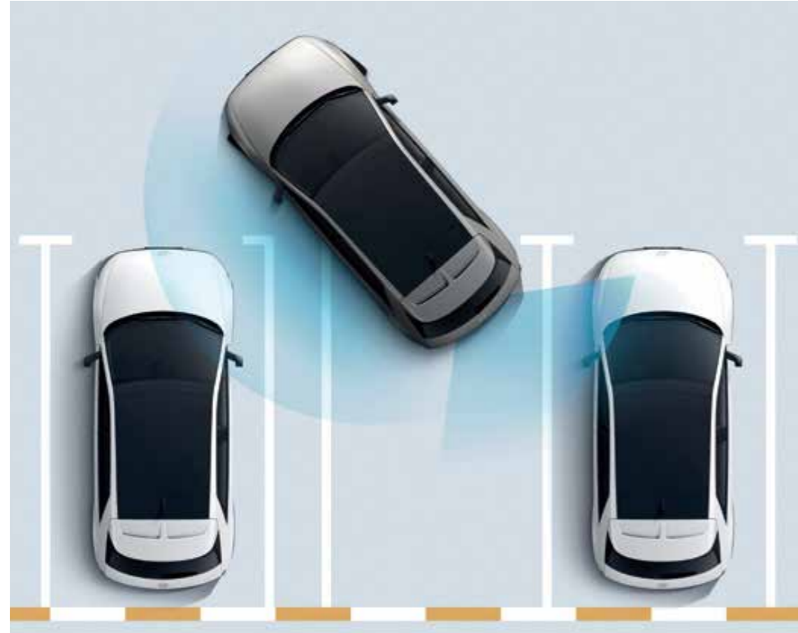
Forward/Side/Reverse Parking Distance Warning (PDW) Forward/Side/Reverse Parking Distance Warning (PDW) warns against collisions with objects around the vehicle at low speeds.

Since the advanced driver assistance system is a function that assists the driver's operation, always drive with caution. The function may not operate smoothly or properly depending on the surrounding environment and driving conditions. In addition, the function may operate with restrictions depending on the regulation related to the certification of the advanced driver assistance system. For details, refer to the owner's manual. The above specifications are applied differently depending on the trim, powertrain, and specifications directly selected by the vehicle purchaser in consideration of price and preference.