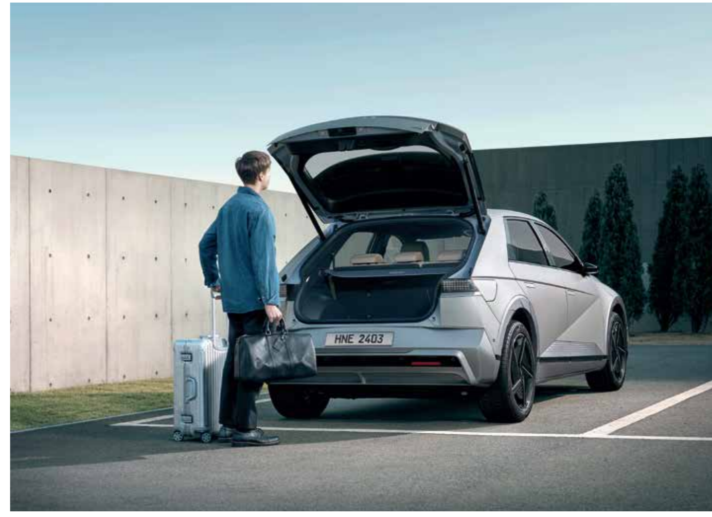
Smart Power Tailgate