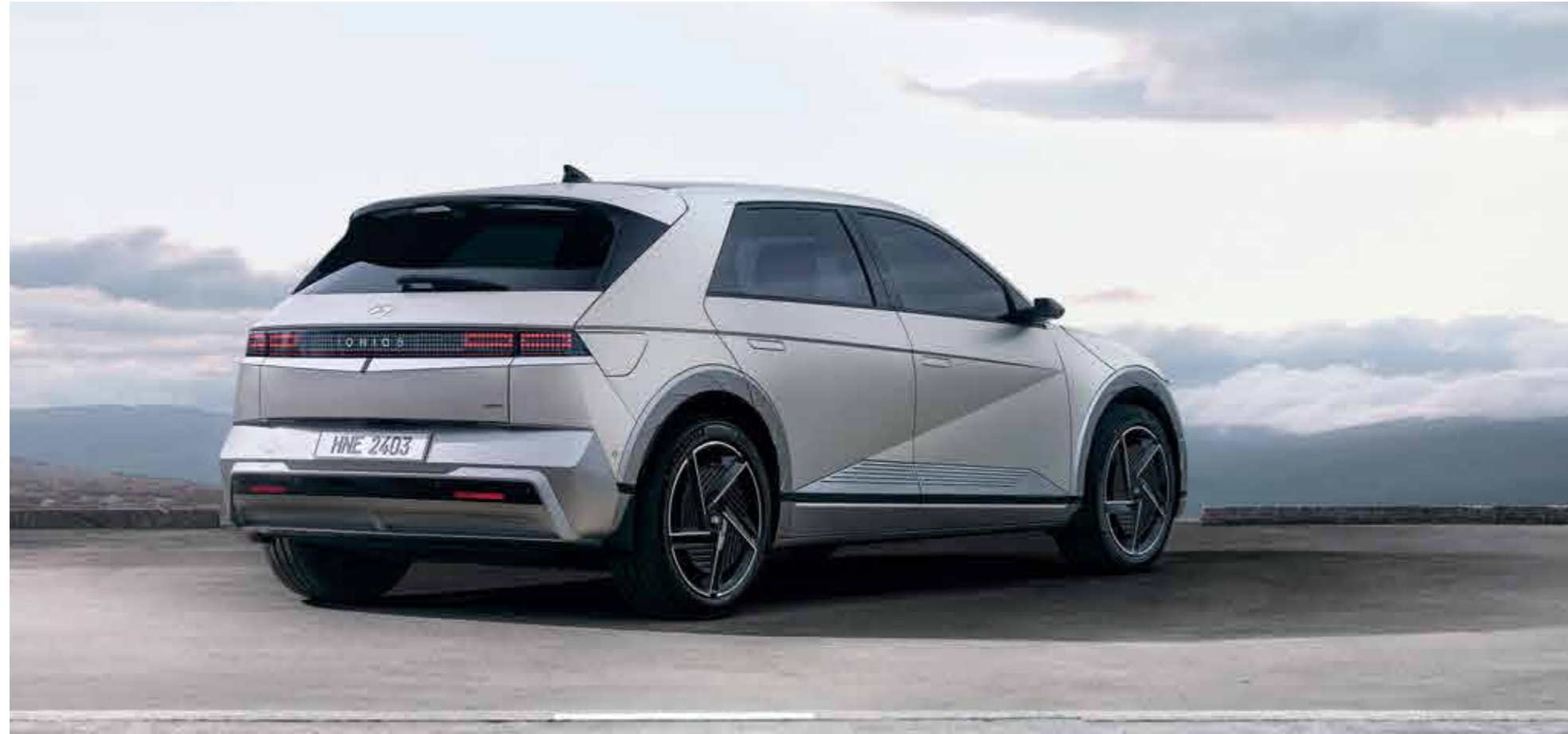
Wide Rear Skid & Bumper Design / Full LED Rear Combination Lamps

The innovative LED lighting design with the signature Parametric Pixels can be found in the back as well, while rear spoiler adds sleekness to the design.