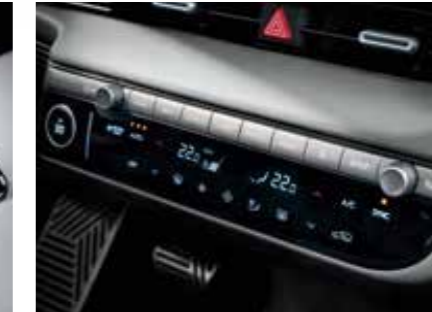
Automatic dual zone air-conditioning