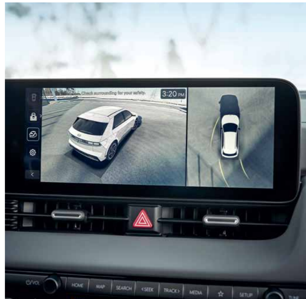
Surround View Monitor (SVM)