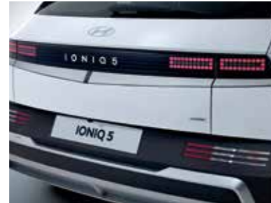
Rear Combination Lamps (Bulb Type)