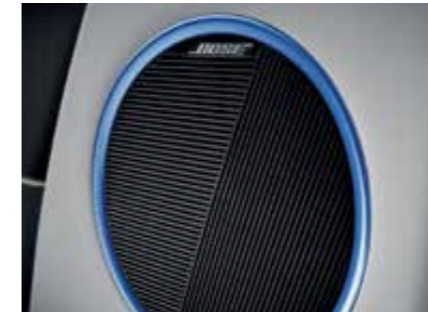
BOSE® sound system