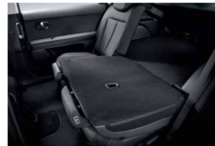
Integrated Memory Seat 2nd-row Seat Remote Folding