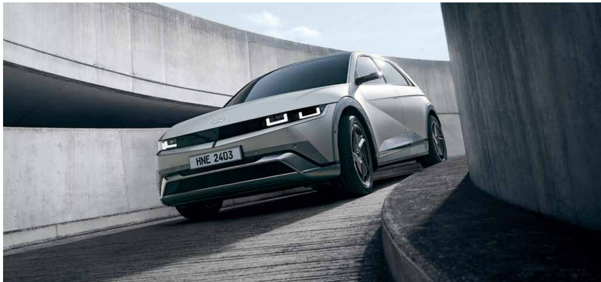
Wide Front Skid & Bumper Design / Full LED Headlamps (Projection Type)

Every inch of the new IONIQ 5 has been carefully refined, including the wheel details, strengthening its iconic design and improving aerodynamics.