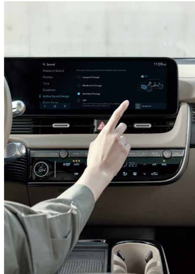
Electric Active Sound Design (e-ASD)