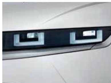
Full LED Headlamps (Projection Type)