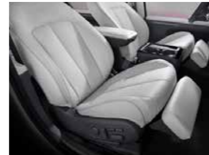
Highly adjustable electric seats