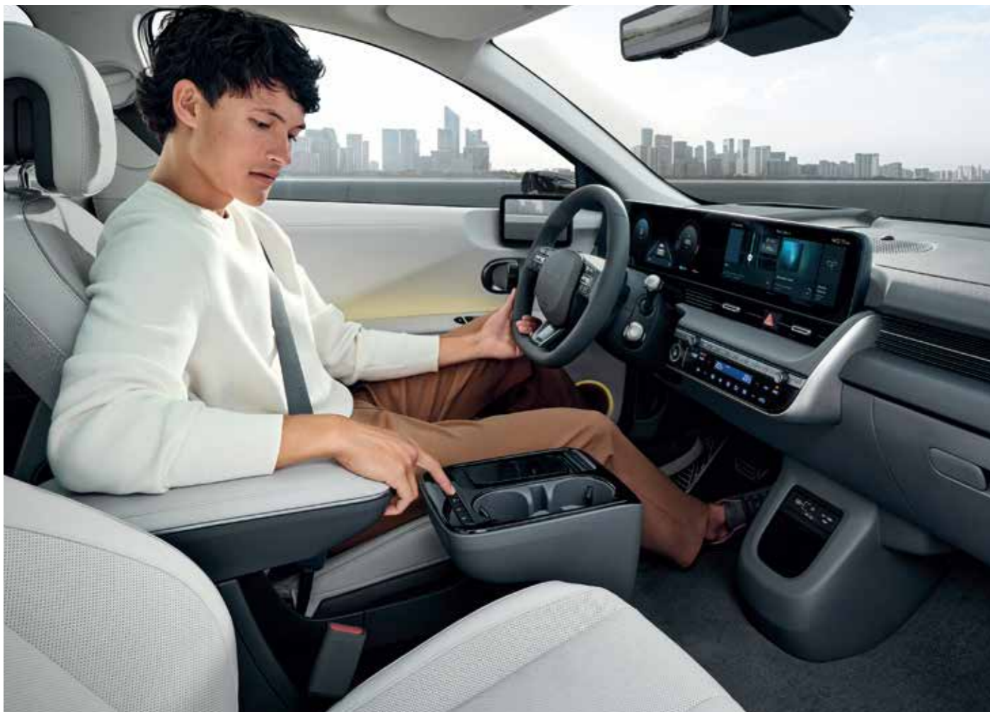
1st-row Heating & Ventilation (Physical Button)

The new IONIQ 5 supports your everyday lifestyle, balancing digital features with practicality for intuitive comfort.