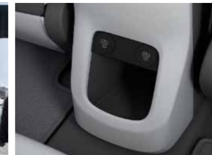
USB ports front and rear