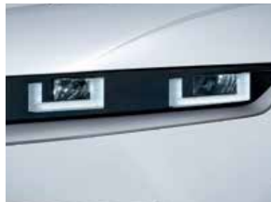
Full LED Headlamps (MFR Type)