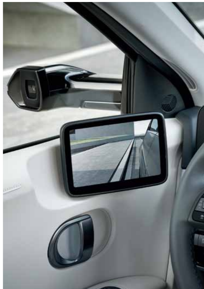
Digital Side Mirror (DSM)