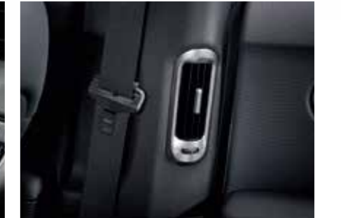
Rear air vents