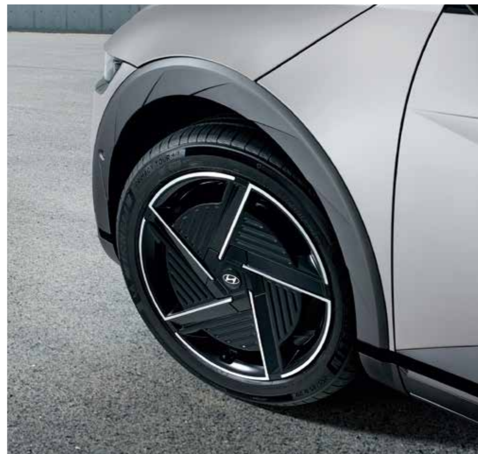
20-inch Alloy Wheels