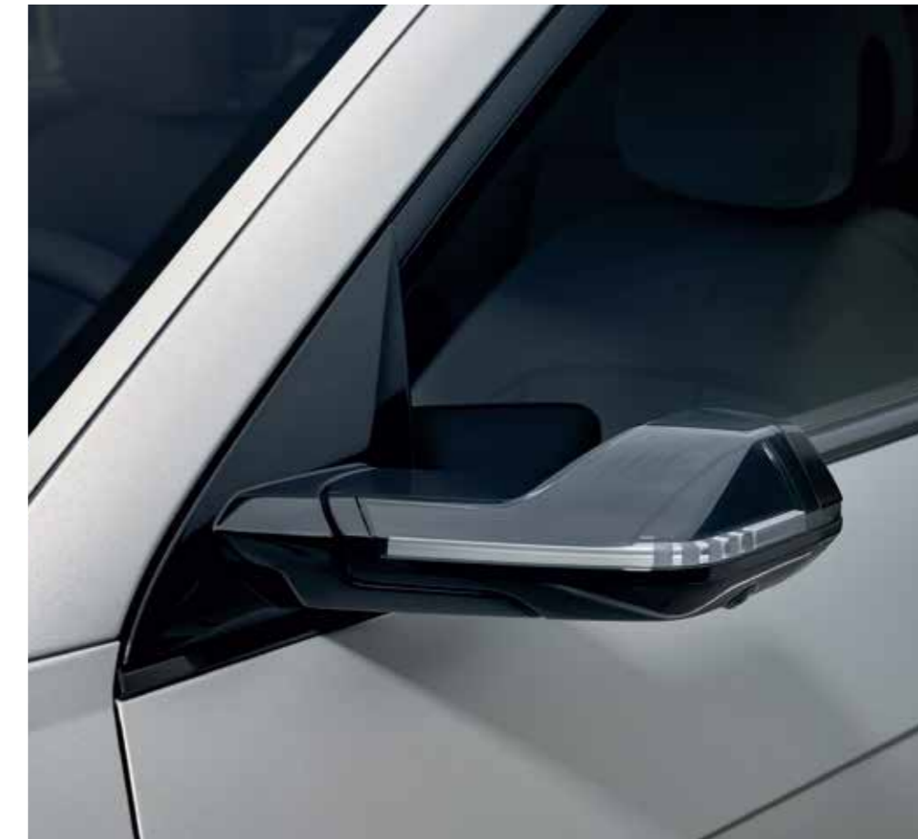
Aerodynamic Digital Side Mirror (DSM)