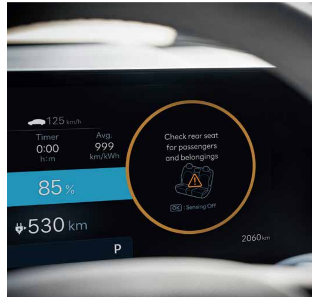
Occupant Alert (ROA)