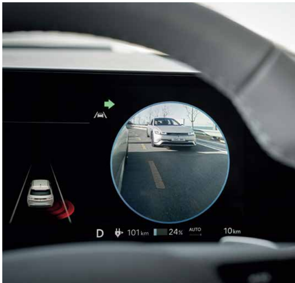
Blind-Spot View Monitor (BVM)

Reinforced with advanced technologies staying alert to provide you a more relaxed and safe journey.