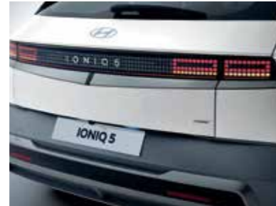
LED Rear Combination Lamps