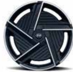
20" Alloy Wheels