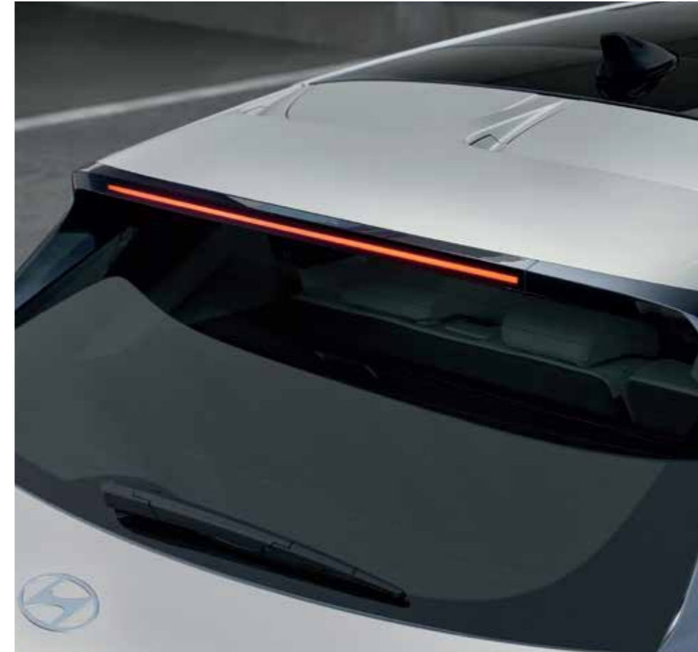
Aerodynamic Rear Roof Spoiler