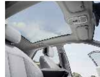
Vision Panoramic Fixed Sunroof