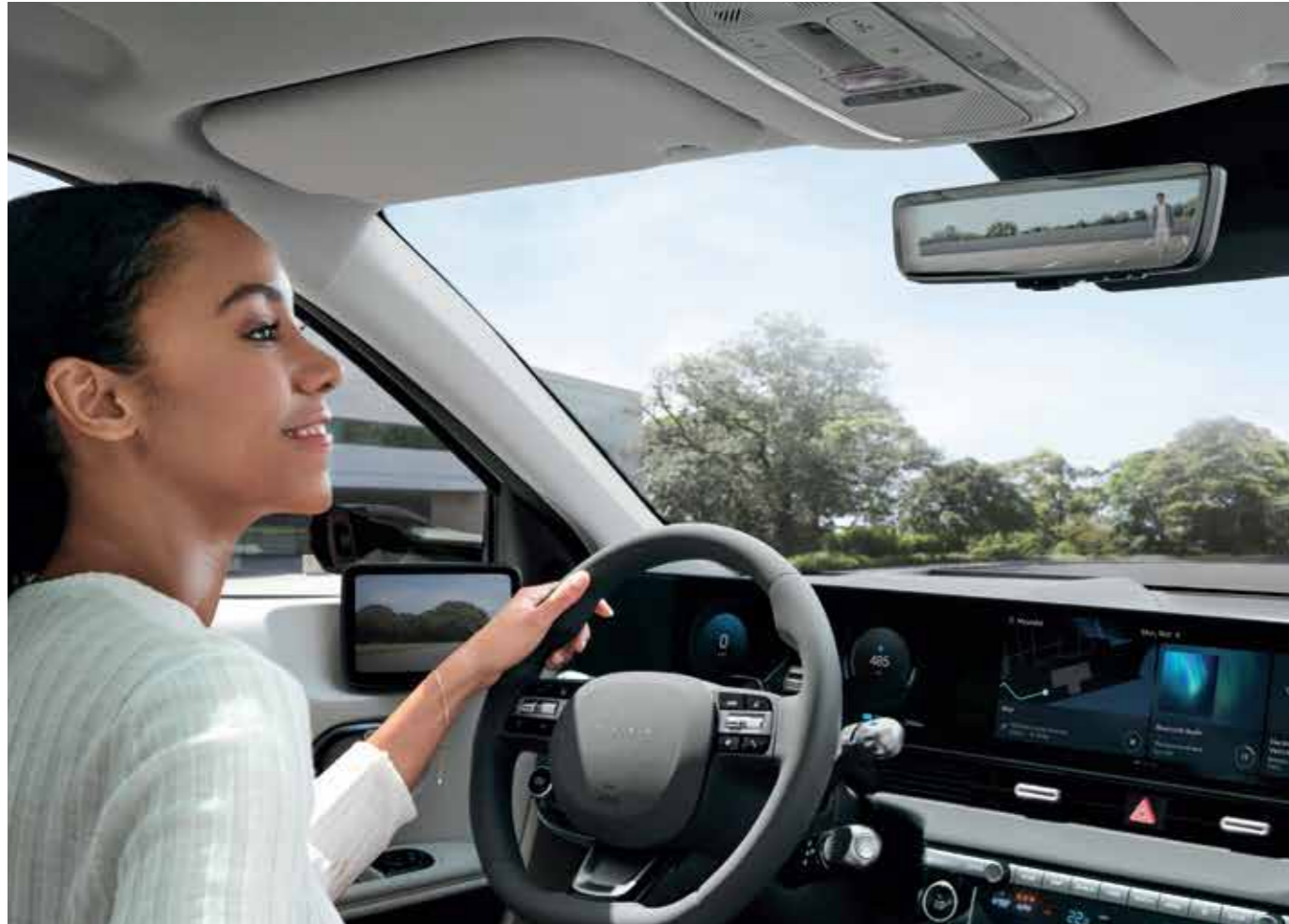
Digital Center Mirror (Full-Display Rearview Mirror)

Ready to assist you to focus on your own journey, boasting the wide selection of innovative features.