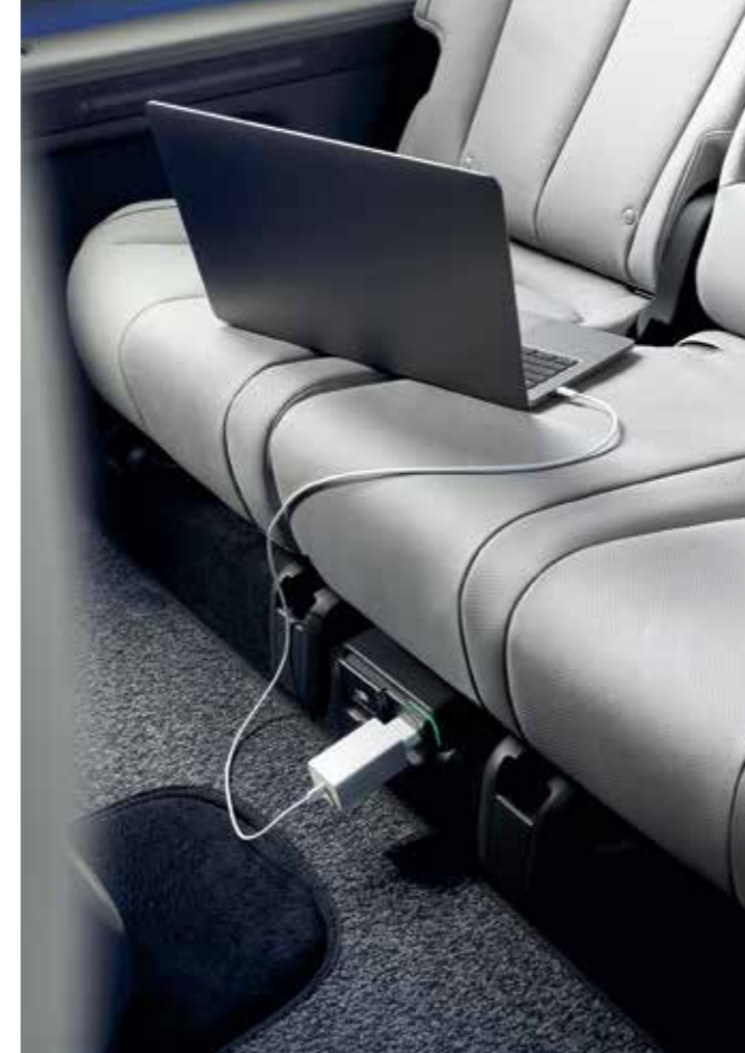
Vehicle-to-Load (Inside V2L)