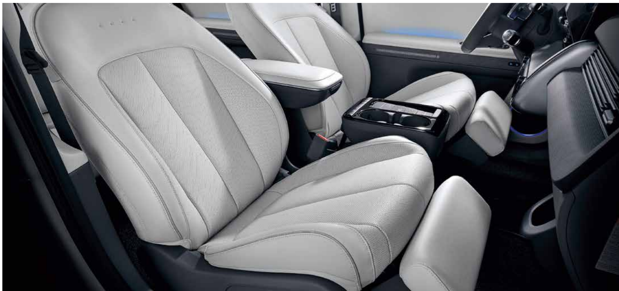
Front Premium Relaxation Seat

Enhanced technologies hidden under premium materials and simple design provide comfort and versatility.