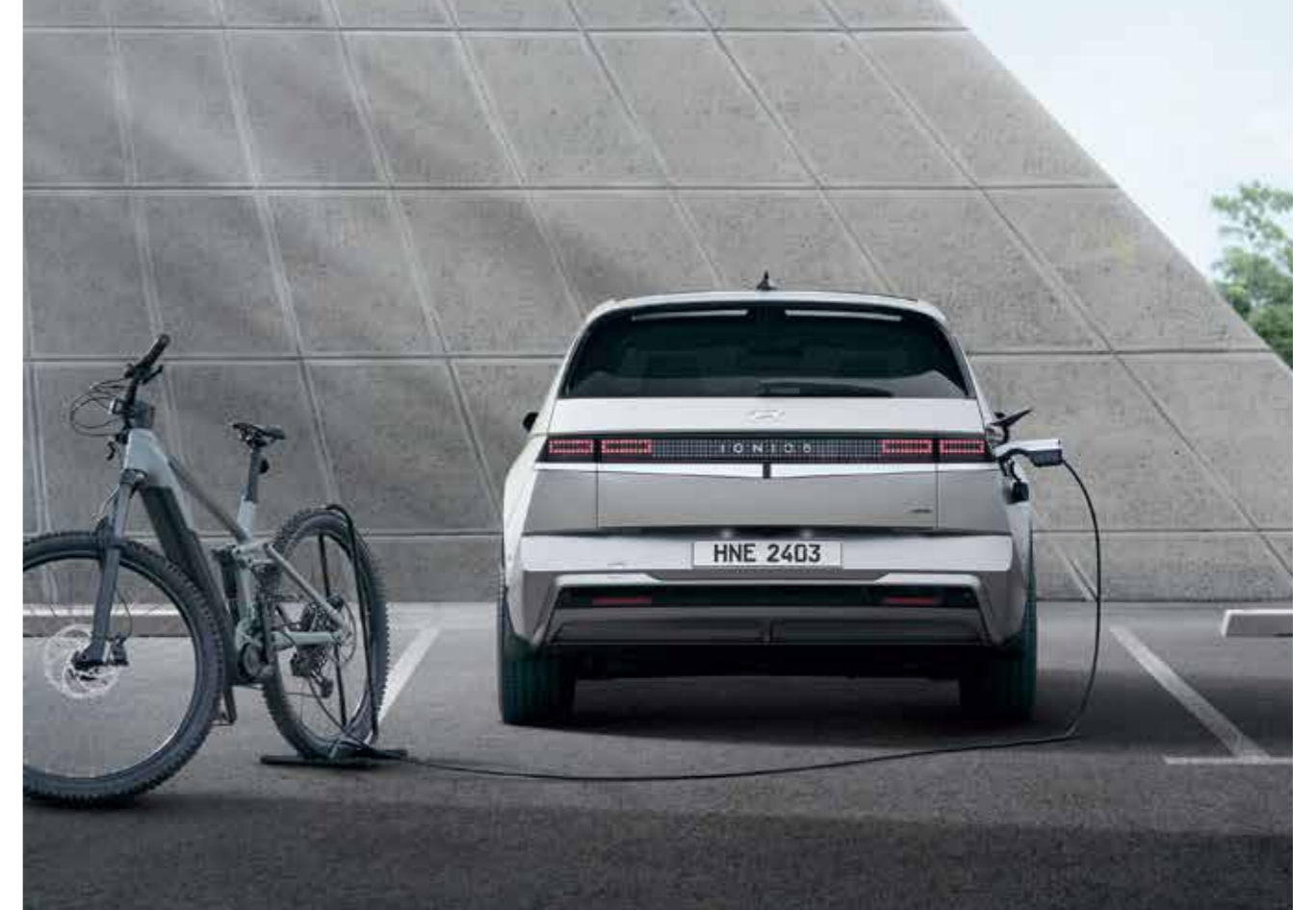
Vehicle-to-Load (Outside V2L)