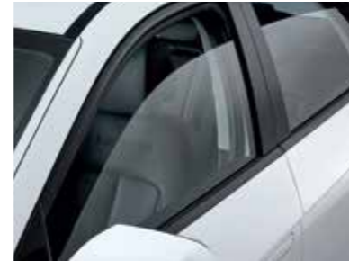
1st & 2nd-row Acoustic Glass