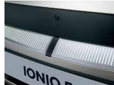
Garnish Hidden Lighting