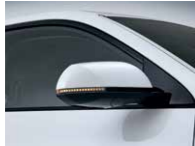
Turn Signal Indicator LED Outside Mirror