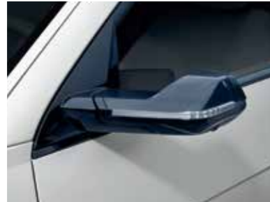
Aerodynamic Digital Side Mirror