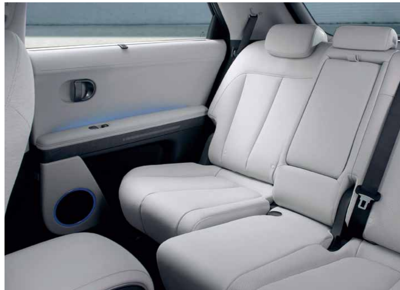
2nd-row Power Sliding (LH/RH) Seat