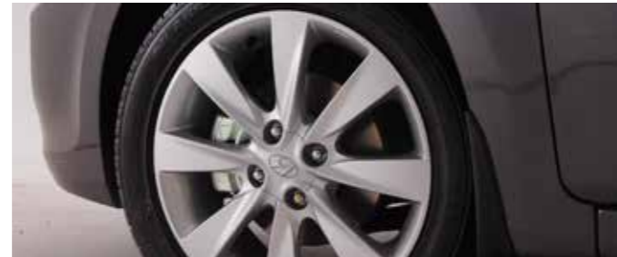
16" Alloy wheels