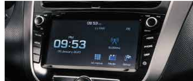
7" Touch screen