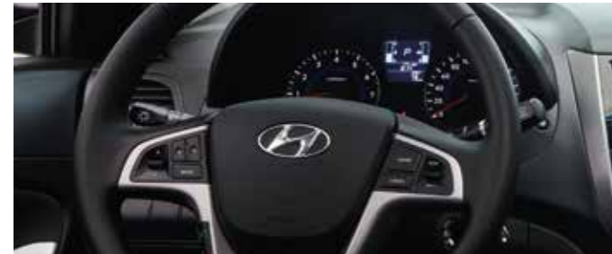
Multi function steering wheel