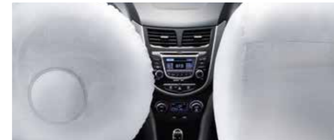
Dual front airbags