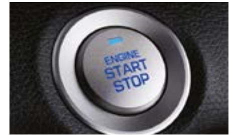
زر تشغيل/إيقاف المحرك