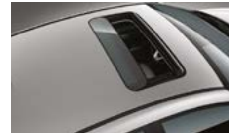
فتحة سقف كهربائية