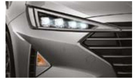
فوانيس امامية باضاءة LED