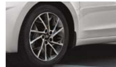
جنود سبور مقاس 17" مع Tire pressure monitoring system