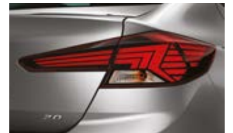
فوانيس خلفية LED