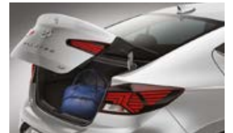
فتح صندوق الأمتعة بدون مفتاح