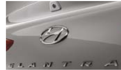
كاميرا الرؤية الخلفية