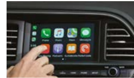
شاشة مقاس 7" مع Apple Car Play / Android Auto Support

أنفرد عن من حولك بتصميم النترا الجديد تتمتع النترا الجديدة بتصميم جري يعطيك إحساساً بالأنفراد و التميز. تأتي المقدمة بشبكة جديدة سداسية الأضلاع و تغير كامل في مصابيحها الأمامية و الخلفية للتأكيد عن انفرادها عن غيرها من السيارات.