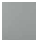
T2X Typhoon Silver