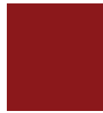
R57 Red Mulberry