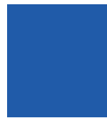
BE7 Galaxy Blue