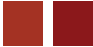
YR2 Lava Orange