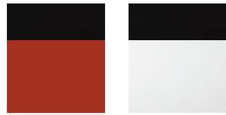
YR1 Lava Orange + Phantom Black roof